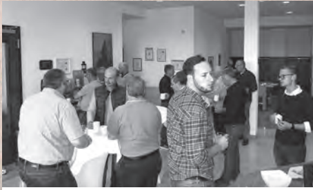
Erfahrungsaustausch in der Pause