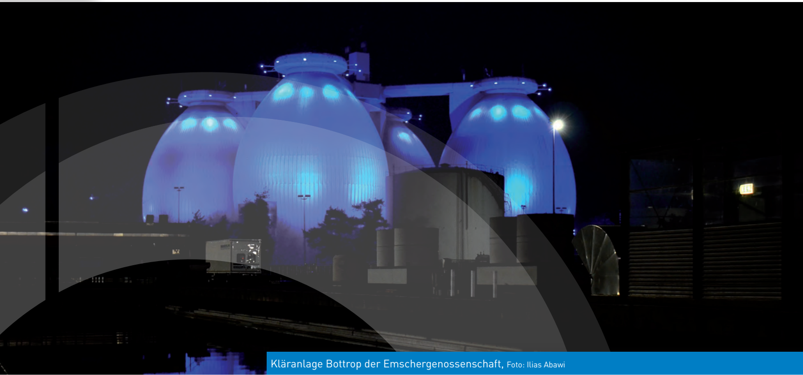
Kläranlage Bottrop der Emschergenossenschaft