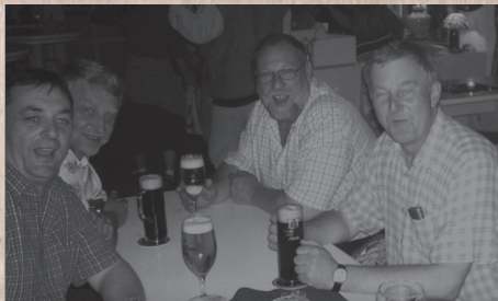
Gemütlicher Ausklang nach einem Seminartag